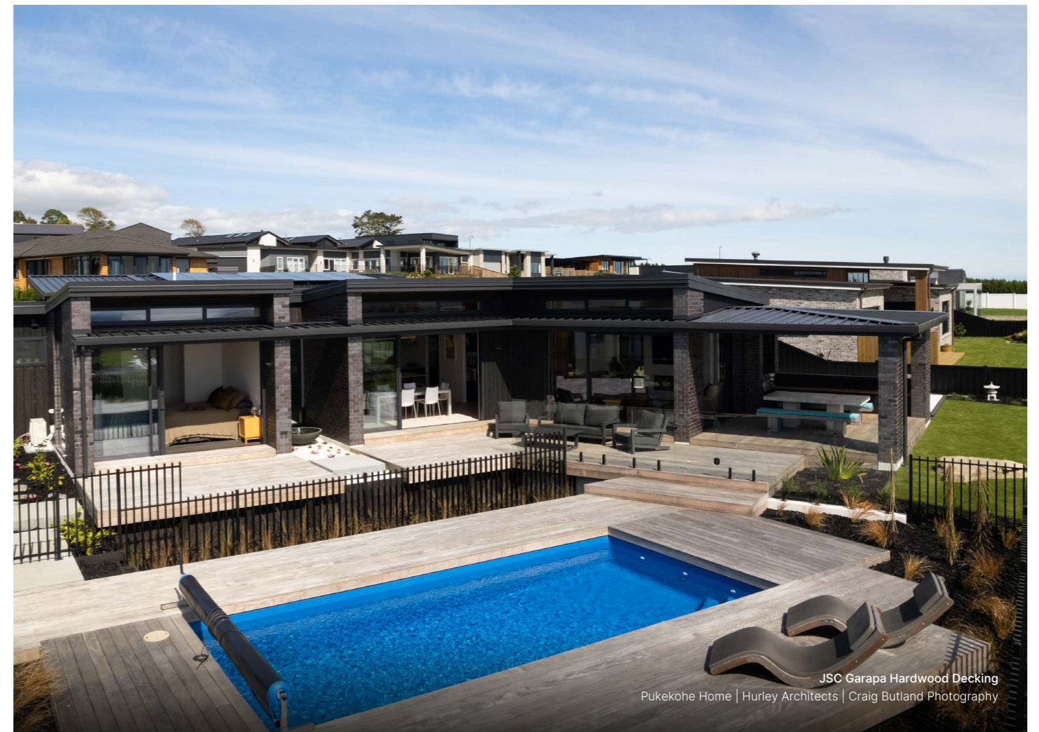
JSC Garapa Hardwood Decking Pukekohe Home | Hurley Architects | Craig Butland Photography