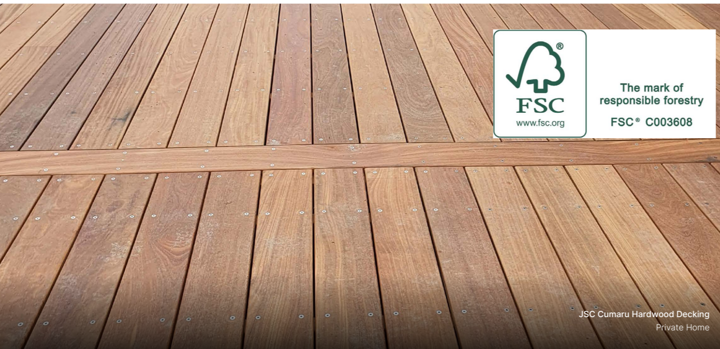
JSC Cumaru Hardwood Decking Private Home